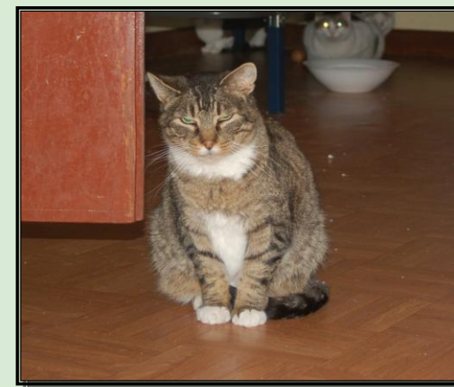
OTTO en acogida, con dieta renal y medicación