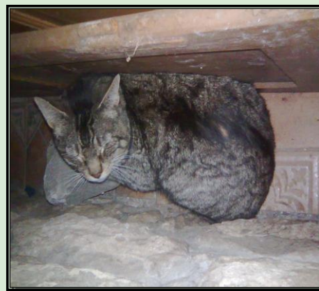
OTTO cuando le conocimos hace 3 años